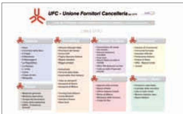
La pagina dei links utili.