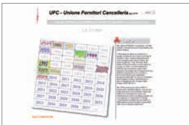
La pagina dedicata alla storia dell'Associazione.

Si è appena conclusa la ricerca che analizza il mercato delle macchine distruggi documenti, ma ne sono previste a breve almeno altre due. Questo approccio di contenere i costi e dare risposte in tempi più rapidi è in linea con le esigenze del mercato ed è stato molto apprezzato dai Soci. Infine, ultima novità, UFC prevede di cambiare sede quest'autunno: gesto che suggerisce ottimismo e voglia di fare.