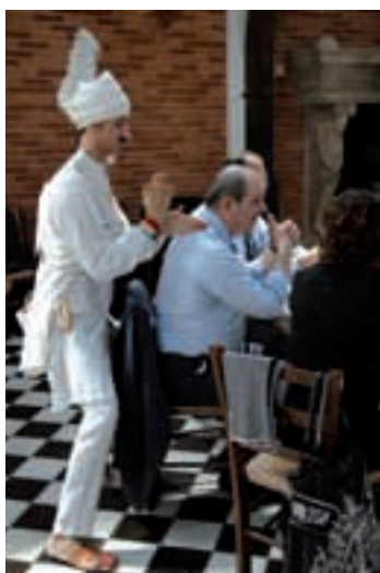
Il Mimo Alberto intrattiene gli ospiti.

Come sempre il nostro sito cresce con noi; da qui in poi seguiranno ancora diverse altre implementazioni già scelte».